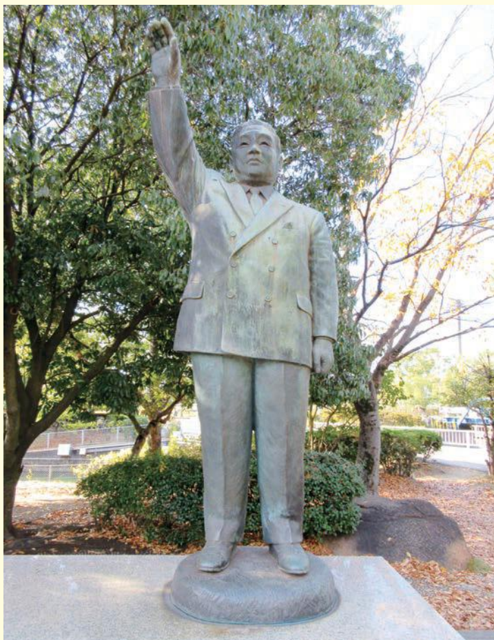
三木行治像（倉敷市水島緑地福田公園）